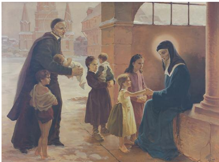
Aurelio Galleppini (Casal di Pari 1917 - Chiavari 1994), "San Vincenzo con Santa Luisa de Marillac e i trovatelli a Parigi", affresco (Cagliari, Cappella dell'Istituto San Vincenzo).

pronunziare la loro sentenza e sapere se non volete più avere compassione di loro. Vivranno se continuate ad averne una cura caritatevole, al contrario moriranno e periranno infallibilmente se li abbandonerete: l'esperienza non vi permette di dubitarne". Questo drammatico e caloroso appello ottenne il risultato voluto. L'opera fu continuata.