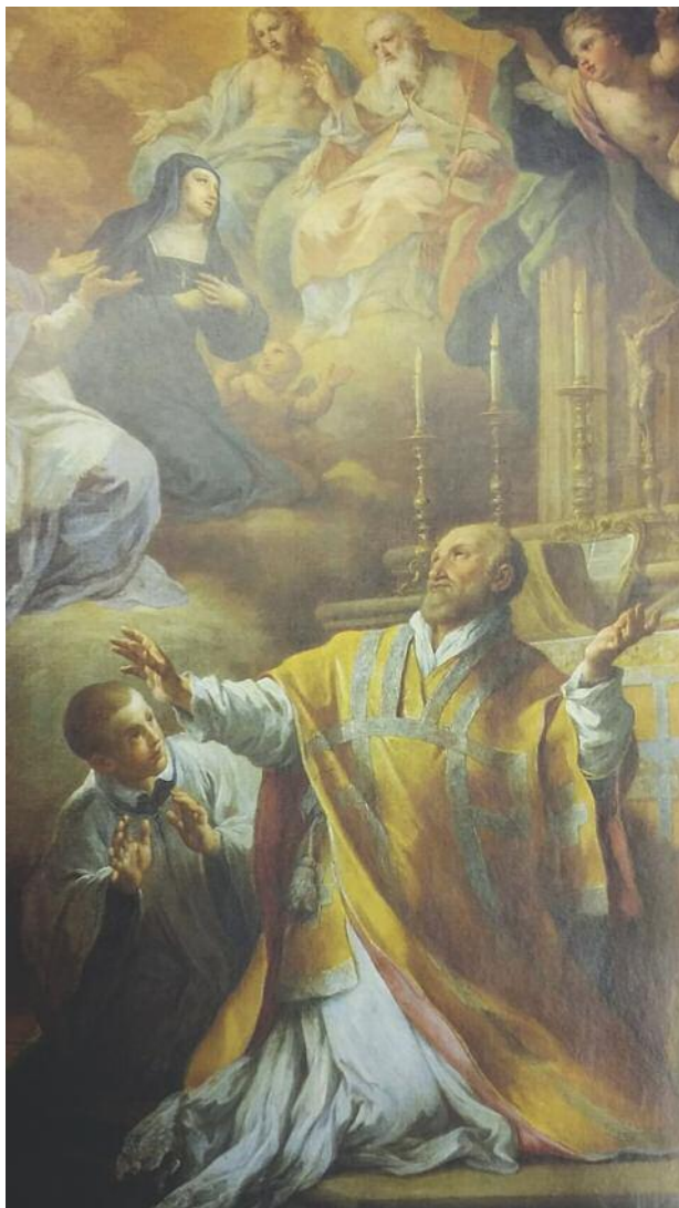
Sebastiano Conca (Gaeta, 1680 - Napoli, 1764), "Estasi di san Vincenzo de'Paoli con visione di san Francesco di Sales e della beata Giovanna di Chantal" (detta dei tre globi), 1751, olio su tela (Roma, Monastero della Visitazione).