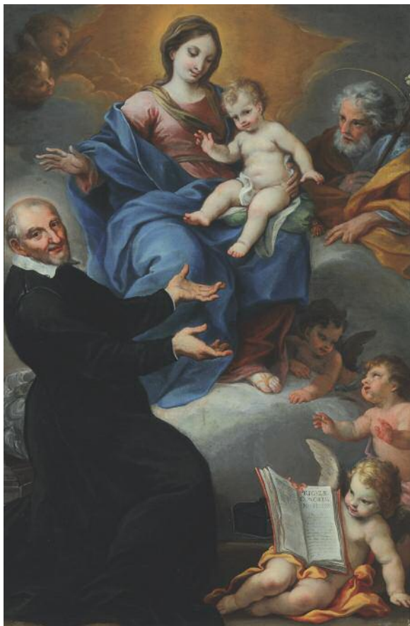
Salvatore Monosilio (Messina, 1715 - Roma, 1776), "San Vincenzo de' Paoli presenta le Regole della Congregazione della Missione alla Sacra Famiglia", olio su tela (Roma, Collegio Leoniano).

gregazione si allargò e, pochi anni dopo, il 12 gennaio del 1633 ricevette l'approvazione papale con la bolla "Salvatoris Nostri" di Urbano VIII. Forte di questa approvazione, san Vincenzo allargò il suo campo d'azione verso i sacerdoti, quando la Provvidenza lo dotò dell'ampio caseggiato di San Lazzaro.