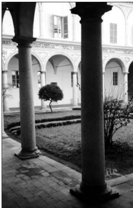
Il chiostro del monastero di San Raimondo.