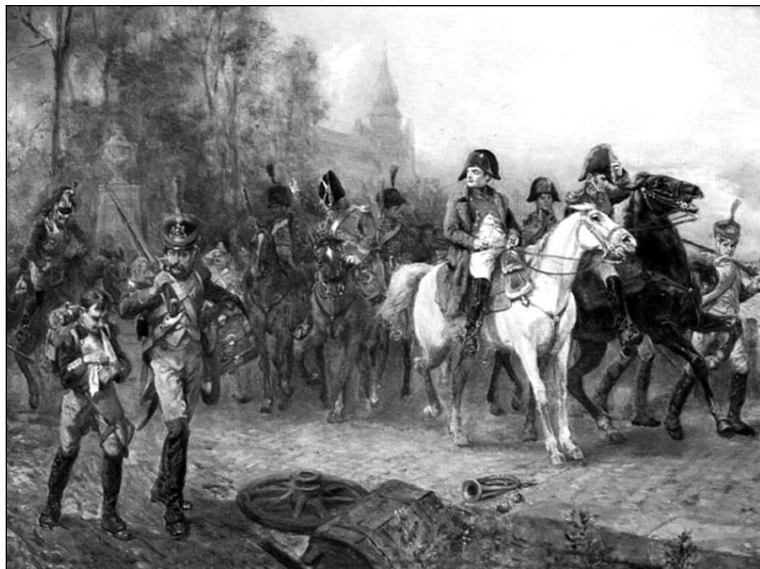
"Napoleone e le sue truppe", opera di Robert Alexander Hillingford , 1812.

no in ogni angolo qualcosa di valore da poter portar via. È il settembre del 1810: il conflitto tra il generale francese e le autorità ecclesiali si è inasprito, e la volontà di sostituire alla religione cristiana la fede laica, porta a una nuova ondata di soppressioni. Chiese, conventi, istituti religiosi: tutto quello che ha il marchio di un'eternità che