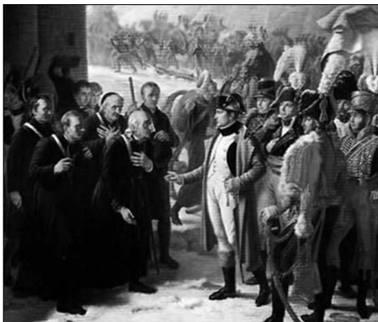
"Napoleone e i monaci", dipinto di Robert Alexander Hillingford.

Se nel cosiddetto triennio giacobino, dal 1796 al 1799, la Chiesa piacentina non aveva subito scosse profonde, cambia tutto dopo la morte del duca di Parma e Piacenza Ferdinando di Borbone: dall'ottobre 1802 i ducati entrano nell'orbita della repubblica francese; tre anni do-