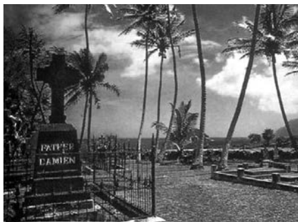
Cimitero di Kalawao, la Tomba di Damiano fino al 1936.

Una volta tornata ad Honolulu, conferì al missionario dei Sacri Cuori la croce di cavaliere dell’Ordine reale di Kalakaua. Lui la indossò solo nel giorno della consegna. “Non si adatta con la mia vecchia sottana rammendata”, diceva ridendo. Non gli interessavano la gloria e gli onori. Padre Damiano voleva solo fare la volontà di Dio. Cattolici, protestanti, laici: tutti, lontano da Molokai,