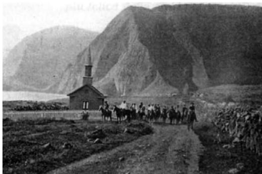
Una foto d'archivio di padre Damiano con i suoi lebbrosi.

peccati. Padre Modesto, dalla nave, gli dette l'assoluzione. Un'altra scena di amore in una terra infernale. Cristo era davvero arrivato a Molokai.