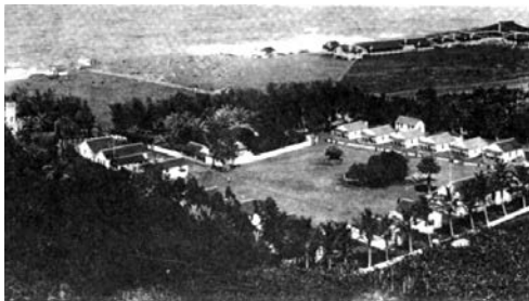
Il villaggio costruito da padre Damiano.

Certo, per il giovane sacerdote belga non deve essere stato semplice. Ma lui era il pastore, il