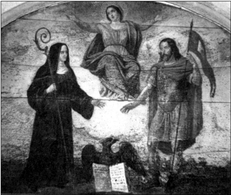
La Beata Vergine Assunta con Santa Giustina e Sant'Antonino, affresco della lunetta della sagrestia superiore della Cattedrale di Piacenza.

da non furono più amministrate dai duchi.