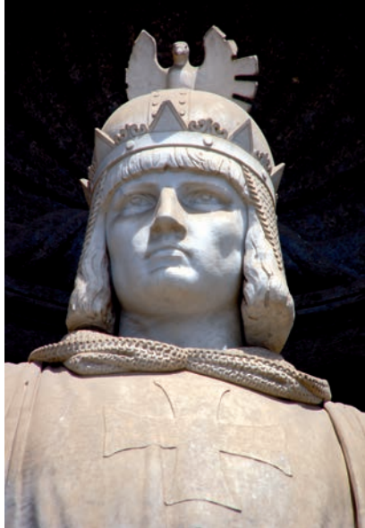
Federico II (Napoli, Palazzo Reale).

Non è un obiettivo semplice: Federico II – com'è prevedibile – rifiuta di concedere una tregua e dispone gravi pene per coloro che si mettono in viaggio per parteciparvi. Il Pecorara non demorde. Sale fino a Meaux, nei dintorni di Parigi, dove raduna i prelati spronandoli a partire.