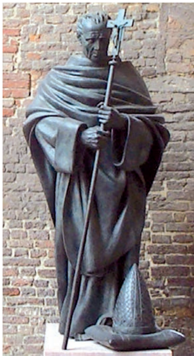
Giorgio Groppi, "Gregorio X" (Piacenza, basilica di S. Antonino).

In secoli di lotte sanguinose, Gregorio X, al secolo Tedaldo Visconti, rampollo di una delle più illustri famiglie di Piacenza, operò solo e soltanto per la riconciliazione, aggrappato