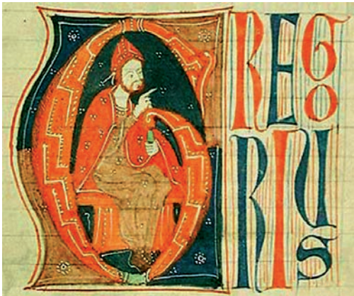
Papa Gregorio IX ritratto in un manoscritto medievale (Universitätsbibliothek Salzburg, M III 97, 122rb, ca. 1270).

dio imperiale – e ad eleggere il canonista Sinibaldo Fieschi di Lavagna, che prese il nome di Innocenzo IV. Si aprirono le trattative con l’Imperatore. Il Papa richiese l’immediata restituzione di tutti i territori usurpati allo Stato pontificio. Federico era disposto a cederne una parte, e solo a scomunica revocata. Di stanza a Terni, invita il Pontefice nella vicina Narni per un colloquio chiarificatore. Diffusa la voce che si trattava di una trappola, Innocenzo IV deviò verso Civitavecchia, da dove – siamo nel giugno 1244 – si imbarcò per Genova, diretto a Lione.